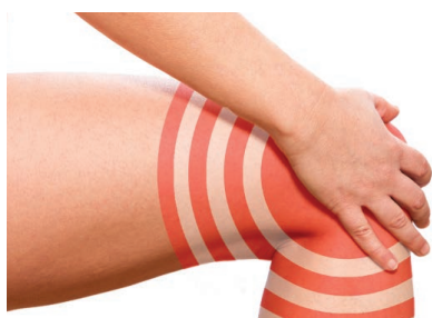
Knieschmerzen mindern die Lebensqualität

Vektor-Lycopin hat die Bestell-Nummer 29400, die Packung für 45 Tage kostet 49,00 €, Vektor-Glucoflex hat die Bestell-Nummer 25001, die Monatspackung kostet 63,00 € (ab 2 Stück 50,00 €).