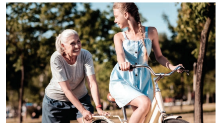
Agil und frisch dank Vektor-NADH

Die Monatspackung Vektor-NADH kostet 59,90 € (Bestell-Nummer 50050). Die Quartalspackung kostet 148,00 €.