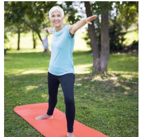
Besonders Senioren profitieren von Synervit

Ältere Studien zeigten, dass zu hohe Homocystein-Werte und Herzinfarkte einen engen Zusammenhang haben. Dies muss man heute korrigieren, doch es bleibt Fakt, dass eine Senkung des Homocysteinspiegels bzw. die Einnahme von Synervit die Gefäße elastischer macht und daher vor der Verkalkung schützt. Insofern ist Synervit auch ein Segen für alle, die erste ernste Durchblutungsprobleme haben, die an ersten Symptomen von Herzschwäche (Angina pectoris) leiden und die aufgrund ei-