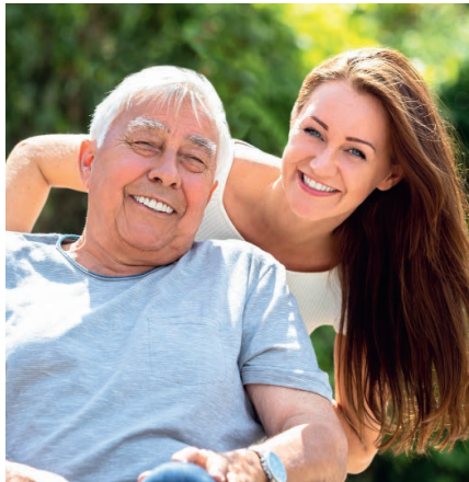
Gesund, lebensfroh und glücklich - nur ein aktives Immunsystem macht das möglich

Ursprünglich wurde AHCC in den späten 80er Jahren als natürliches Mittel zur Regulierung von Bluthochdruck entwickelt. Doch schon bald erkannten Forscher seine außerordentlich positiven Auswirkungen auf das Immunsystem. Bis heute wurden 400 Studien gemacht. Immer wieder konnte bewiesen