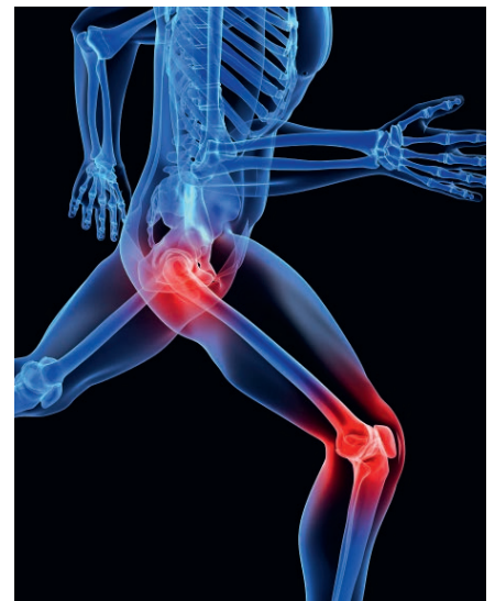
Gelenkschmerzen mindern die Lebensqualität

Vektor-Lycopin hat die Bestell-Nr. 29400, 90 Kapseln für 45 Tage kosten 49,00 €, Vektor-Glucoflex hat die Bestell-Nr. 25001, 150 Kapseln für 30 Tage kosten 64,90 € (ab 2 Stück je 52,00 €).