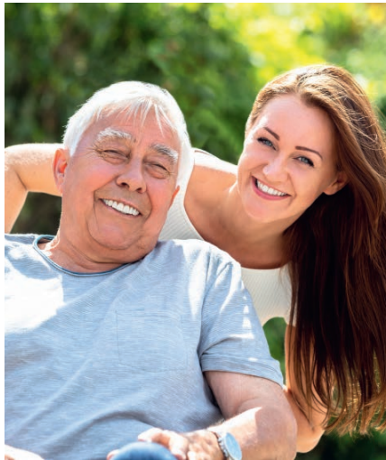
Gute Gesundheitstipps wollen geteilt werden: Achten Sie aufeinander, auch das hält fit!

In Sachen Gesundheit ist Japan für Forscher seit jeher ein spannendes Land, ist hier die Lebenserwartung doch beständig überdurchschnittlich hoch. Interessant ist in diesem Zusammenhang die hohe Affinität der Japaner zu Nahrungsergänzungsmitteln und funktionellen Lebensmitteln. Ganz vorne mit dabei: AHCC (Active Hexose Correlated Compound), das sich als Top-Immunbooster bewährt hat. Eigentlich hatte man diese „Super-Pilze“ in den späten 1980er Jahren als natürlichen