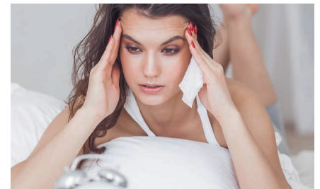
Schwache Abwehrkräfte sind eine Gefahr.

Vektor-AHCC hat die Bestellnummer 50020, die 30-Tage-Kur kostet bis Ende April nur 145,00 € statt sonst üblich 165,00 €.