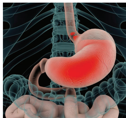
Oft unterschätzt: Die Wichtigkeit von Magensäure

Vektor-HCL hat die Bestell-Nummer 50040, die Zwei-Monatspackung kostet 74,80 €.