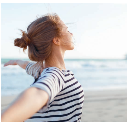
Befreiend: Das tolle Gefühl nach einer Entgiftung

Multi-20 hat die Bestell-Nr. 19800, die 60-Tage-Packung kostet im April 44,90 € statt 49,90 €.