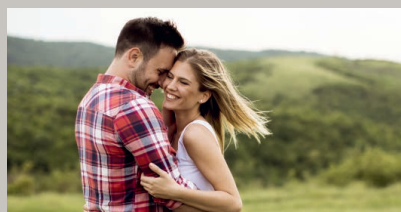
Auch in schweren Zeiten zuversichtlich bleiben

Den Körper so wenig wie möglich zu belasten und bestmöglich zu unterstützen, ist in diesen Tagen noch wichtiger als ohnehin schon (siehe dazu auch Artikel oben). Neben gesunder Ernährung und Bewegung sind regelmäßige Entgiftungskuren darum das A und O.