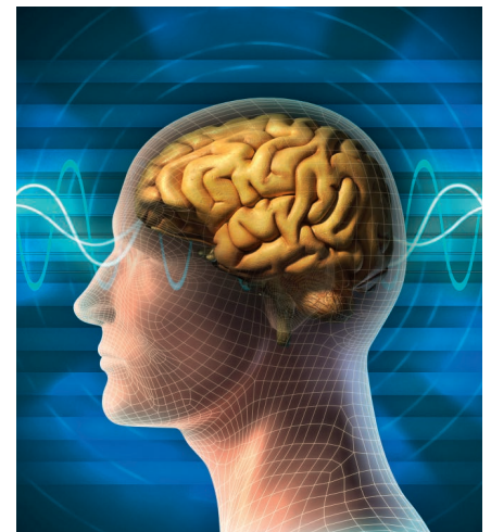
Dopamin stärkt das Hirn

Vektor-NADH hat die Bestell-Nummer 50050 (Monatspackung 59,90 Euro) bzw. 50055 (Quartalspackung 148,- Euro)