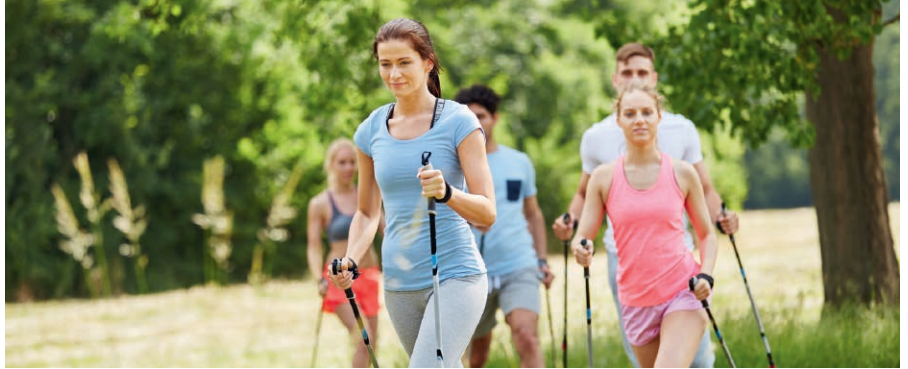
Rundum fit und glücklich dank Vektor-Nattokinase

Mangeldurchblutung ist ein immenses gesundheitliches Problem. Und wenn man älter wird, sich weniger bewegt und der Stoffwechsel nach und nach erlahmt, verstärkt sich das Problem von Jahr zu Jahr. Es macht daher Sinn, ab dem 45. Lebensjahr wenigstens einmal, besser jedoch zweimal im Jahr die Durchblutung anzuregen und das Blut auf natürliche Art zu verdünnen und dadurch die Fließfähigkeit bis in die kleinste Kapillare zu verbessern. Das Mittel der Wahl für eine Kur, die das Blut wieder fließen und den Körper reaktivieren