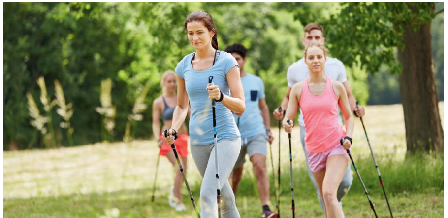
Bewegung gehört zu einem gesunden Lebensstil dazu und bringt den Stoffwechsel in Schwung.

Herkömmliche Blutverdünner haben allerdings leider häufig schädliche Nebenwirkungen. Nicht so das Naturpräparat Vektor-Nattokinase! Im Gegenteil, die Nebenwirkungen, die hier in Studien beobachtet wurden, waren ausnahmslos positiv, etwa, dass es die Enzyme im Körper hemmen kann, die normalerweise die Blutgefäße verengen und dadurch den Blutdruck erhöhen. Unsere Experten raten Menschen im mittleren bis höheren Lebensalter zu