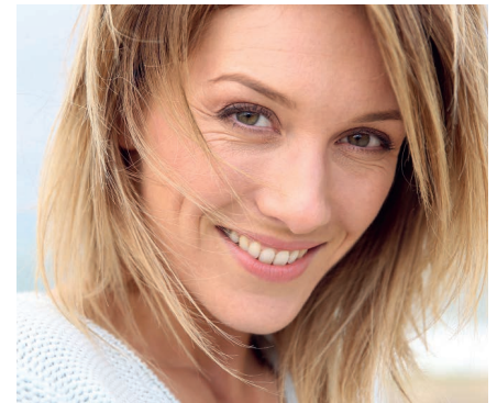
Vektor-NADH bringt neuen Schwung

Vektor-NADH hat die Bestell-Nummer 50050 (Monatspackung 59,90 €) bzw. 50055 (Quartalspackung 148,00 €).