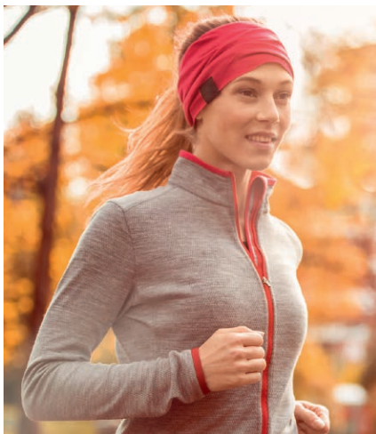
Entgiftung steigert die Lebensfreude

Vektor-Resveratrol hat die Bestell-Nummer 50005, die Monatspackung kostet 69,80 €.