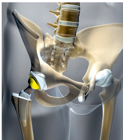
Hat jeder zweite Senior: Ein künstliches Hüftgelenk

Gelenkprobleme haben neben falscher Ernährung und Bewegungsmangel auch zwei spürbare Komponenten, zum einen Entzündungen, zum anderen einen Knorpelabbau.