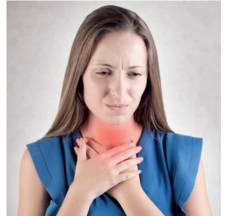
Sodbrennen ade! Vektor-HCL hilft dabei.

Hierfür empfehlen unsere kritischen, der Naturheilkunde verpflichteten Ärzte das Naturprodukt Vektor-HCL, dass die Säureproduktion auf natürliche, schonende Weise anregt: ein aus der Zuckerrübe gewonnenes Betain-HCL (englisch: HCL), das mit dem patentierten