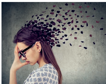
Vergesslichkeit mindert die Lebensqualität

Vitamin D3+K2 hat die Bestell-Nr. 19500, 60 Kapseln für 60 Tage kosten 34,90 € (ab 2 Stk. je 29,90 €).