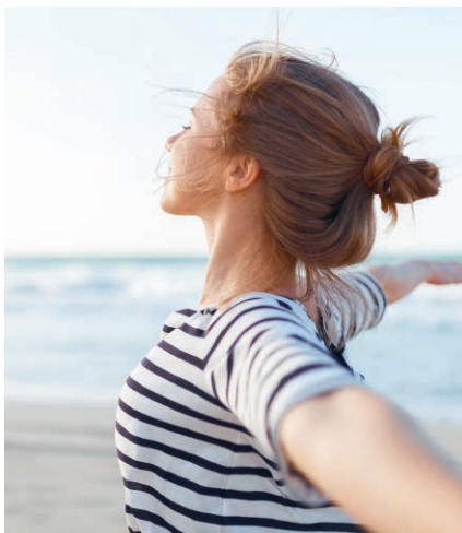
Mehr Lebensfreude durch Detoxkuren

Life Force Multiple hat die Bestellnummer 24002, die Packung für zwei Monate kostet 98,00 € (ab 2 Stk. 89,00 €).