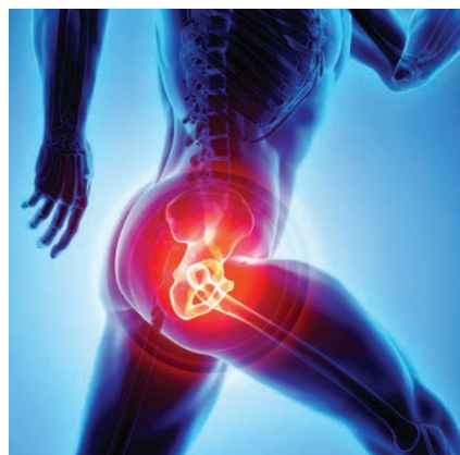
Osteoporose sorgt für schmerzende Gelenke

Wir haben schon häufiger im Newsletter geschrieben, dass die im Alter gefürchtete Knochenentkalkung kein Problem einer zu geringen Kalziumaufnahme ist, sondern ein Problem zu hoher Homocysteinwerte. Deswegen ist Synervit in Kombination mit dem Produkt Coral-Calcium bei Osteoporose perfekt, weil gleichzeitig die Homocysteinwerte gesenkt werden und die Kalziumaufnahme erheblich verbessert wird. Aber was ist, wenn