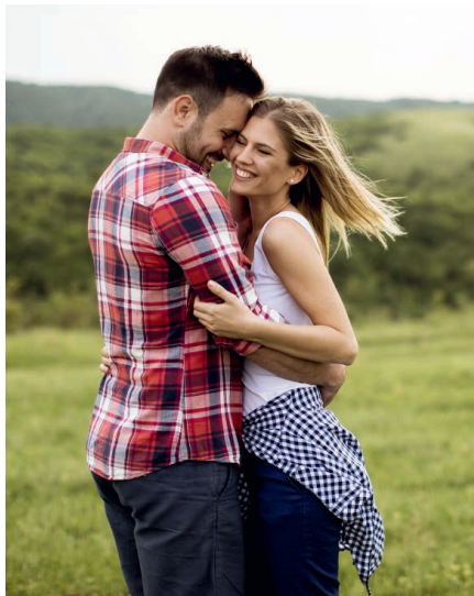
Auch die Seele profitiert von einer Detox-Kur

Über vieles lässt sich streiten, in einem Punkt sind sich aber auch die unterschiedlichsten Menschen einig: Unsere Gesundheit gehört zum Wertvollsten was wir haben. Entsprechend viel Aufmerksamkeit sollten wir ihr schenken und sie gegen Bedrohungen von außen bestmöglich schützen. Neben gesunder