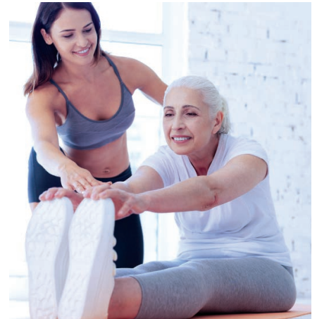
Synervit – damit Sie auch im Alter fit bleiben

Ältere Studien zeigten, dass zu hohe Homocystein-Werte und Herzinfarkte einen engen Zusammenhang haben. Dies muss man heute korrigieren, doch es bleibt Fakt, dass eine Senkung des Homocysteinspiegels bzw. die Einnahme von Synervit die Gefäße elastischer macht und daher vor der Verkalkung schützt. Insofern ist Synervit auch ein Segen für alle, die erste ernste Durchblutungsprobleme haben, die an ersten Symptomen von Herzschwäche (Angina pectoris) leiden und die aufgrund