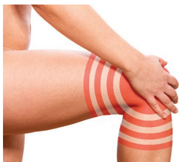
Wenn Gehen zur Last wird: Knieschmerzen

Mit Vektor-Lycopin steht ein Produkt zur Verfügung, das Entzündungen gezielt abbaut und die typischen Schmerzen bei Arthrose und Arthritis wirkungsvoll mindert. Vektor-Lycopin setzt dazu ausschließlich pflanzliche Stoffe ein, die anders als reine Schmerzmittel