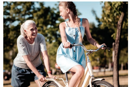
Agil und frisch dank Vektor-NADH

Die Monatspackung Vektor-NADH kostet 59,90 Euro (Bestell-Nummer 50050). Die Quartalspackung kostet 148,- Euro.