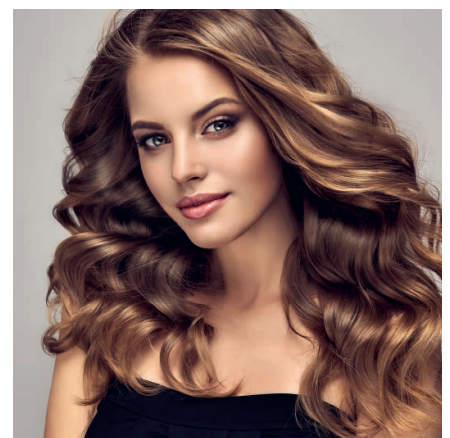
Vektor-Beauty-Hair gibt Kraft und Schwung

Ja, diese Überschrift erscheint zunächst paradox, zumal, wenn sie von einem Arzt kommt. Doch ich meine das ganz ernst: Auch wenn es grundsätzlich natürlich sinnvoll ist, auf eine ausgewogene Ernährung zu achten, tut es nicht gut, sich permanent jegliche fettige, süße oder alkoholhaltige „Sünde“ zu versagen. Denn manchmal braucht unsere Seele einfach ein bisschen derartiges „Futter“. Wichtig ist lediglich, dass Sie die Balance im Auge behalten. Das bedeutet: „Wappnen“ Sie Ihren Körper so, dass er mit gelegentlichem Überdie-Stränge-Schlagen gut zurechtkommt. Ich persönlich setze dafür auf regelmäßige Entgiftungskuren mit Biologo-Detox, schütze meine Gefäße mit Synervit und kurbele meine Verdauung und meinen Stoffwechsel mit Vektor-HCL an. Derart gerüstet habe ich keinerlei schlechtes Gewissen, wenn ich mir abends ein Glas Rotwein gönne, dem Griffin die Pralinschachtel nicht widerstehen kann oder mir auch mal einen deftigere Imbiss hole.