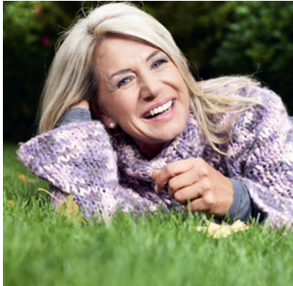
Fit und fröhlich durch die Wechseljahre: Dank Meno kein Problem!