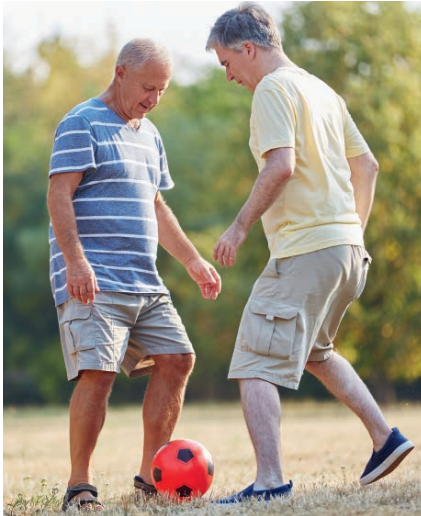
Wach, aktiv und wieder gut drauf