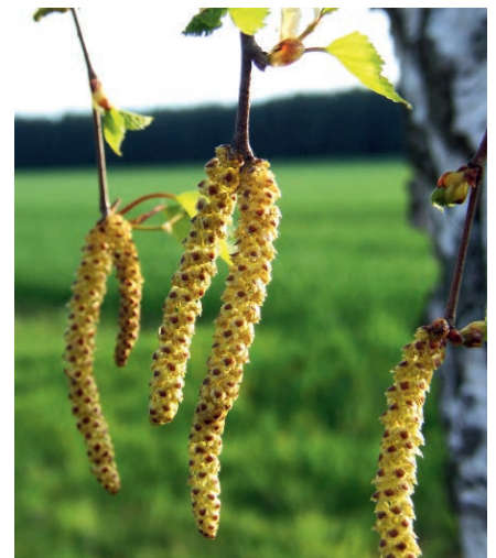
Birkenpollen sorgen für juckende Augen und Nasen

Vektor-AHCC als Monatskur mit 60 Kapseln für 30 Tage kostet 165,00 €. Die Bestell-Nummer lautet 50020.