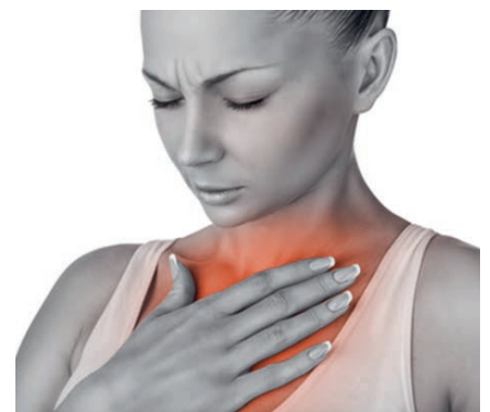
Sodbrennen schmerzt ungemein

Sodbrennen ist kein Problem von zu viel, sondern von zu wenig Magensäure, auch wenn die Pharmaindustrie etwas anderes behauptet. Weil die Nahrung ohne Magensäure gärt,