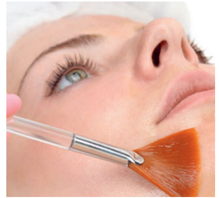
Die perfekte Ergänzung zur Kosmetik von außen: Pflege von innen mit Vektor-Resveratrol

Die Harvard-Wissenschaftler glauben, dass man mit einer täglichen Einnahme von Resveratrol 20 Jahre länger leben kann. Wir sagen: Wenn es gelingt, mit Vektor-Resveratrol die Adern, das Herz, das Gehirn und die Zellen jung zu