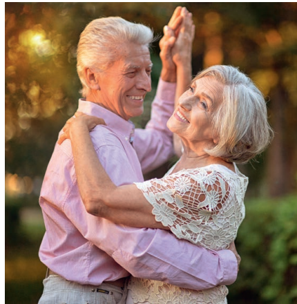
Rundum glücklich: Ein starkes Immunsystem hält gesund und stärkt die Lebensfreude

Ursprünglich wurde AHCC in den späten 80er Jahren als natürliches Mittel zur Regulierung von Bluthochdruck entwickelt. Doch schon bald erkannten Forscher seine außerordentlich positiven Auswirkungen auf das Immunsystem. Bis heute wurden 400 Studien gemacht. Immer wieder konnte bewiesen