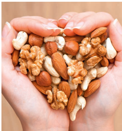
Stecken voller wertvoller B-Vitamine: Nüsse, Mandeln und Cashewkerne

reduziert der erlahmte Stoffwechsel die Aufnahme von B-Vitaminen. Und bei Rauchern und Raucherinnen gibt es zwei sehr spezielle Probleme, die zum Mangel führen. Nikotin hemmt die Aufnahme und Verwertung von Folsäure und Vitamin B12. Nikotin behindert zudem die Umwandlung von Vitamin B6 in eine aktive Form, die der Organismus verwerten kann. Die Folgen des Vitamin-B-Mangels sind bei allen drei Gruppen gleich: Es gibt zu hohe Homocysteinwerte und dadurch eine höhere Gefahr für Herzinfarkt, Schlaganfall, Osteoporose, Glaukom, Altersdemenz und auch Alzheimer-Krankheit. Daher ist es für diese Gruppe besonders sinnvoll, die drei B-Vitamine zuzuführen und den gefährlichen Mangel auszugleichen. Am besten mit Synervit, dem hochdosierten Homocystein-Senker, der den Bedarf an B6, B12 und Folsäure täglich mit einer Kapsel deckt.