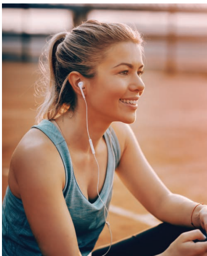
Mehr Wohlbefinden dank Entgiftung

Vektor-Resveratrol hat die Bestell-Nummer 50005, die Monatspackung kostet 69,80 €.