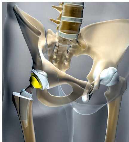
Ohne Vorbeugung droht ein künstliches Hüftgelenk

Das gilt auch für Gelenkprobleme aller Art. Neben falscher Ernährung und Bewegungsmangel gilt es, Entzündungen und Knorpelabbau zu vermeiden.